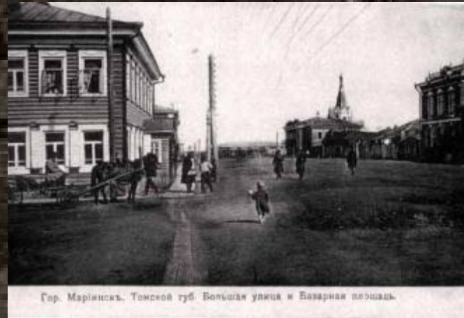
Гор. Мариинскъ. Томской губ. Большая улица и Базарная площадь.

Гор. Мариинскъ, Томской губ. Базарная улица