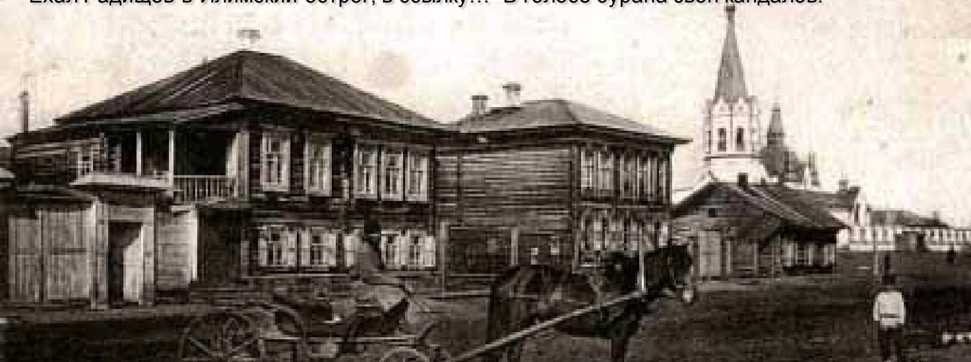
Ст. Мариинск. Железнодорожное здание.

Свою историю в статус города Мариинск пишет с 1856 года. Старый Московский тракт дал дыхание Кийску. По нему в 1791 году проезжал Радищев, который писал потом: «От Кии до Ачинска места прекраснейшие, дубравы для хлебопашества и скотоводства удобные». Ехал Радищев в Илимский острог, в ссылку... В голосе бурана звон кандалов.