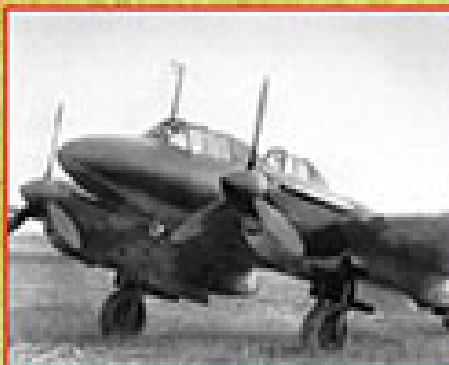
Рассветный бомбардировщик Рв-5, образец 1941 г., конструкторы В.В.Сухомин