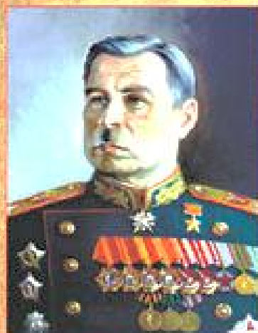
ГОВОРОВ Леонид Александрович (1897 - 1955)