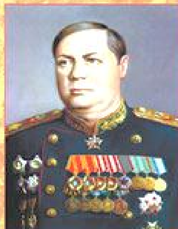
ТОЛБУХИН Фелор Иванович (1894 - 1949)