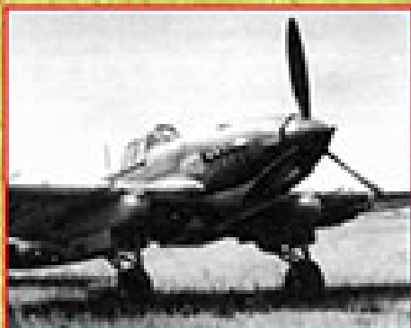
Самолет-истребитель Ил-2 образца 1941 г., конструкторы С.В.Ильюшин