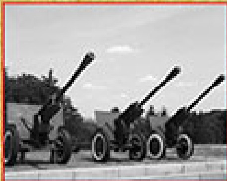
76 мм артиллерийские пушки образца 1940 г. (ЗПК-2), конструкторы В.Г.Гурьев