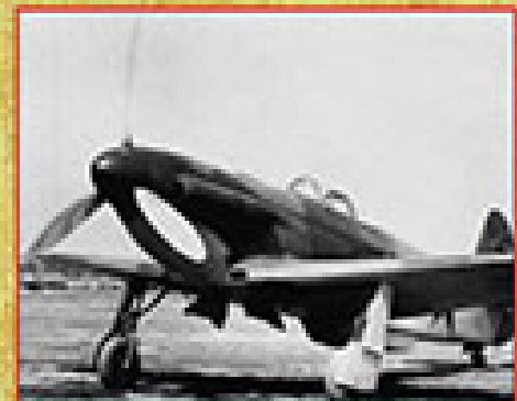
Самолет-истребитель Ил-3, образец 1942 г., конструкторы А.С.Ильюшин