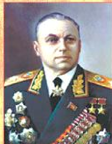
РОКОССОВСКИЙ Константин Константинович (1896 - 1968)