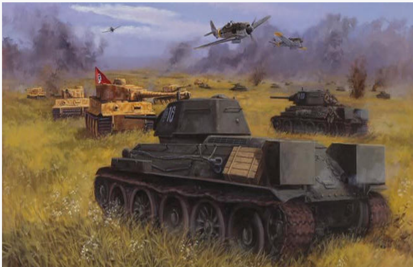
Бой под Прохоровкой

Основной конфликт: Великая Отечественная война, Вторая мировая война