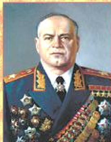
ЖУКОВ Георгий Константинович (1896 - 1974)