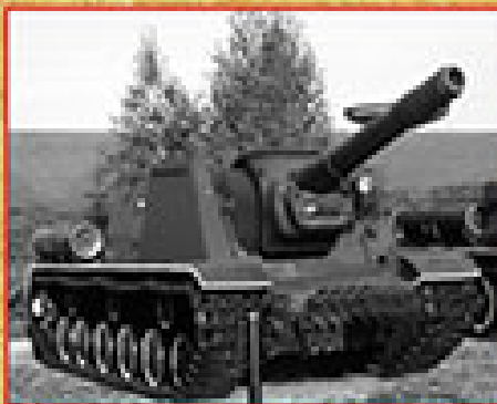
Танковый корпусно-артиллерийский учебный ВВ-102 Березовый, конструкторы И.А.Коробков