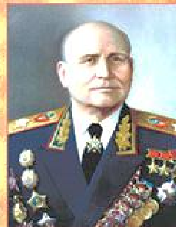
КОНЕВ Иван Степанович (1897 - 1973)