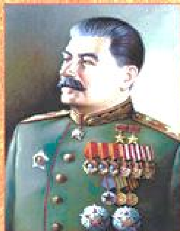
СТАЛИН Иосиф Виссарионович (1879 - 1953)