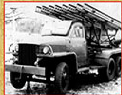
ВВ-10. Катанка образца 1941 г., конструкторы И.А.Гусев, В.А.Григорьев, А.С.Гаврилов и А.С.Томов