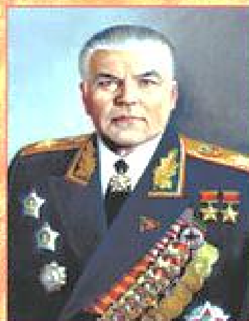
МАЛИНОВСКИЙ Родion Яковлевич (1898 - 1967)