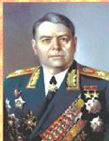
ВАСИЛЕВСКИЙ Александр Михайлович (1895 - 1977)