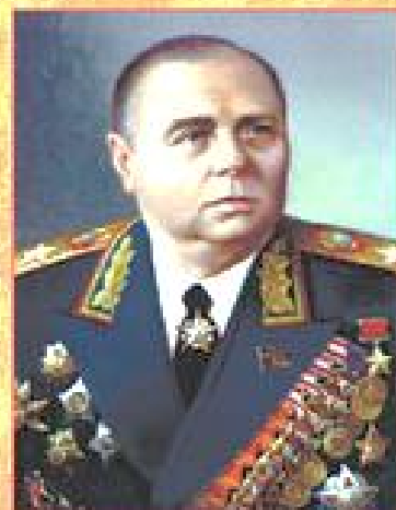
МЕРЕЦКОВ Кирилл Афанасьевич (1897 - 1968)