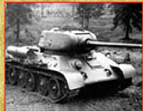
Средний танк Т-34ВВ образца 1940 г., конструкторы А.А.Морозов и И.А.Коробков