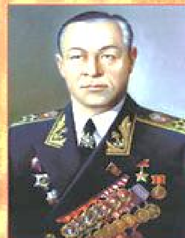
КУЗНЕЦОВ Николай Герасимович (1902 - 1974)